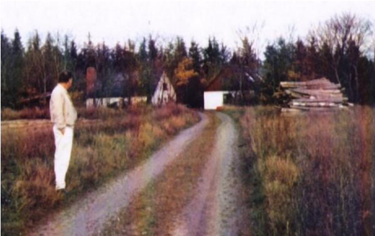
Som huset så ud i 1999. Det er forfatteren til venstre.